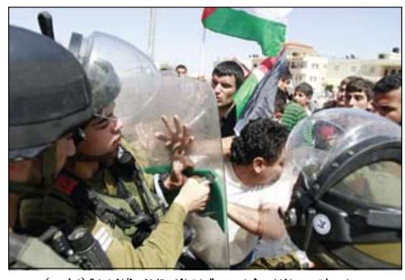
مواجهات بين الفلسطينيين وقوات الاحتلال في الضفة

•• الضفة-غزة-وكالات: أصيب عشرات الفلسطينيين في مواجهات بالضفة الغربية في ذكرى يوم الأرض الذي صادف امس. فقد اندلعت مواجهات بين متظاهرين فلسطينيين وقوات الاحتلال على معبر قلنديا شمال القدس المحتلة. وطلقت قوات الاحتلال المتواجدة بأعداد كبيرة، الرصاص المطاطي وقنابل الغاز على جموع الفلسطينيين، حيث أصيب أكثر من خمسة عشر فلسطينيا بالأصابات مختلفة. وبيت لحم نظم نشطاء تظاهرات ورفوها الاعلام الفلسطينية. أما في قلقيلية، فقد أصيب جنديان احتلاليان خلال مواجهات اندلعت أثناء قيام نشطاء بزراعة ارضنا ومستقبلنا وان الرد الوحيد لاحباط مخططات نهب الارض يكمن في تصعيد المقاومة الشعبية لتعم كل أرجاء الوطن. الى ذلك حذرت الرئاسة الفلسطينية امس من ضياع