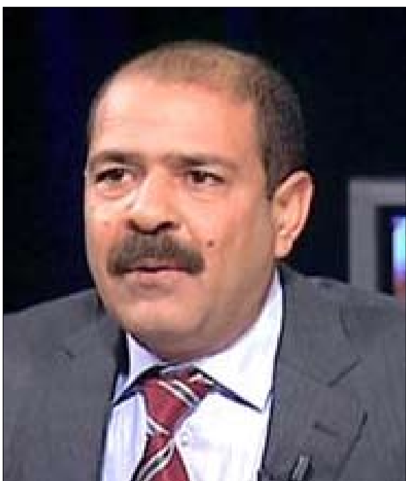
الراحل شكري بلعيد

نداء تونس : تصريحات المرزوقي تقسم وحدة الشعب التونسي قال الطيب البكوش الأمين العام لحركة نداء تونس على هامش المؤتمر الدولي الثماني حول الإسلام والديمقراطية تحت شعار الانتقالات الديمقراطية في العالم العربي ان الرئيس المؤقت المنصف المرزوقي أخطأ في تصريحاته التي قال فيها إن المجتمع التونسي