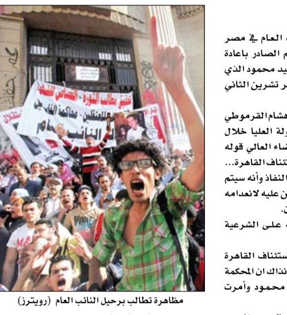
مظاهرة تطالب برحيل النائب العام

كوريا الشمالية تغلق حالة الحرب مع الجنوب •• سيول-وكالات: دخلت كوريا الشمالية مرحلة جديدة من التصعيد الكلامي مع جاريتها الجنوبية وواشنطن، حيث أعلنت حالة الحرب على سول وسط دعوات دولية لخفض التوتر في شبه الجزيرة الكورية. ويشت وكالة الأنباء الكورية الشمالية بيانا صادرا عن الحكومة فجر امس السبت قالت فيه من الآن فصاعدا تدخل العلاقات بين الشمال والجنوب حالة الحرب، وكل ما يتصل بالقضايا المطروحة سيخضع لهذا الاعتبار. وتعليقا على الموضوع قالت المتحدث باسم مجلس الأمن القومي الأميركي كيتلين هايدن شاهدنا التقارير الاخبارية بخصوص بيان جديد غير بناء صدر عن كوريا الشمالية، نحن نأخذ هذه التهديدات بجدية. يشار إلى أن الكوريتين ما زالتا تقنيا في حالة حرب منذ الحرب الكورية خلال أعوام 1950-1953. مع العلم بأن النزاع بينهما انتهى باتفاق على وقف الأعمال العدائية وليس بمعاهدة