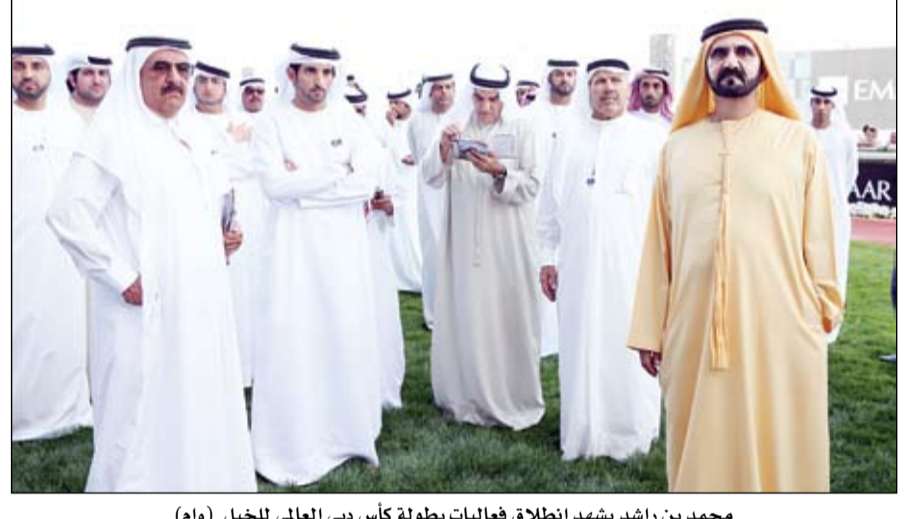
محمد بن راشد يشهد انطلاق فعاليات بطولة كأس دبي العالمي للخيول (وام)

تنفيذا لتوجيهات رئيس الدولة إنجاز مشاريع توصيل المياه لـ 64 قرية باكستانية •• اسلام اباد-وام: تنفيذا لمبادرة وتوجيهات صاحب السمو الشيخ خليفة بن زايد آل نهيان رئيس الدولة حفظه الله بدعم قطاع المياه في الأقاليم والناطق الفقيرة بجمهورية باكستان الإسلامية.. أعلنت ادارة المشروع الإماراتي لمساعدة باكستان الانتهاء من إنجاز وتسليم 64 مشروعا بقطاع المياه للحكومات المحلية في إقليم خيبر بختونخوا ومنطقة جنوب وزيرستان حيث تم الانتهاء من تنفيذ هذه المشاريع خلال المرحلة السابقة وطبقا للخطة الزمنية المحددة للتفتيش بتكلفة قدرها خمسة ملايين و774 ألف دولار أمريكي. وأشار البيان الصادر عن ادارة المشروع الإماراتي لمساعدة باكستان إلى